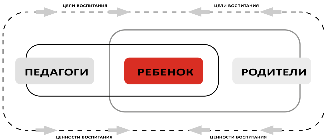
Рисунок 1. Модель идеального взаимодействия образовательной организации и родителей.

Как мы можем видеть на рисунке 1, взаимодействие предполагает интеграцию целей и ценностей воспитания и педагогов, и родителей. При этом необходимо помнить, что ценности и цели родителей и образовательной организации могут отличаться. В этом случае ценности и цели воспитания, транслируемые образовательной организацией, приоритетнее ценностей и целей родителей, так как именно образовательная организация является социальным институтом, действующим как инструмент государства в сфере воспитания подрастающих поколений. В случае отсутствия противоречий между ценностями и целями образовательной организации и родителей и их общей релевантности возможно осуществление продуктивного взаимодействия. Если же такие противоречия существуют, то на плечи образовательной организации ложится задача (подчас довольно сложная, а иногда и совсем нерешаемая) по изменению мнения родителей и принятию ими ценностей и целей воспитания, транслируемых образовательной организацией.