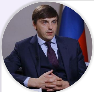
Сергей Кравцов Министр просвещения Российской Федерации