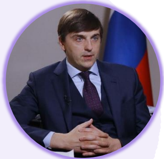
Сергей Кравцов Министр просвещения Российской Федерации

Комментируя установленный порядок формирования списка нормативных словарей, справочников и грамматик современного русского литературного языка ( Постановление Правительства Российской Федерации от 1 июля 2023 г. № 1092) (3 июля, Москва)