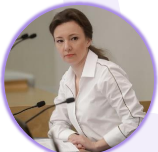
Анна Кузнецова Заместитель Председателя Госдумы

«В ведении Министерства просвещения находится 38 педагогических вузов, в том числе четыре педагогических вуза в новых субъектах Российской Федерации. На сегодняшний день мы видим, что количество ребят, которые подают заявления на направление «Педагогика», в два раза больше, чем в аналогичный период прошлого года, — свыше 160 тысяч заявлений на сегодняшний день»