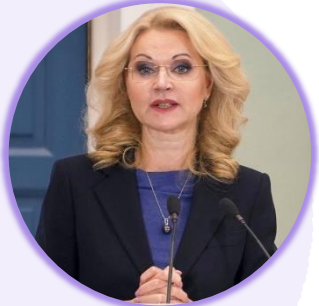
Татьяна Голикова Заместитель Председателя Правительства Российской Федерации

В ходе церемонии вручения дипломов с отличием выпускникам российских педагогических вузов (6 июля, Москва)