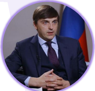
Сергей Кравцов Министр просвещения Российской Федерации

«Профессия учителя становится всё более и более популярной. В этом году из 229 высших учебных заведений, которые готовят педагогов, выходит 88 тысяч новых учителей. Нам очень приятно, что все они пойдут работать педагогами»